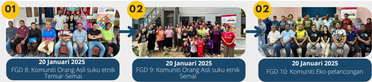
20 Januari 2025 FGD 8: Komuniti Orang Asli suku etnik Temiar-Semai