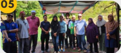
21 Februari 2025 Lawatan Tapak 2: Tasik Pedu