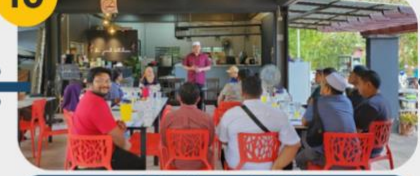
22 Februari 2025 FGD 5: Anak Muda Padang Terap