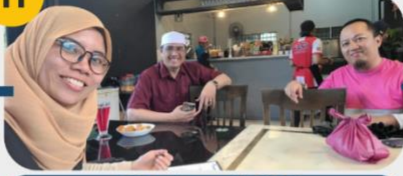
22 Februari 2025 Sesi Temu Bual 2: Wakil Pekerja Ekonomi Gig (P-hailing)