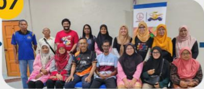
22 Februari 2025 FGD 3: Komuniti FELDA Lubok Merbau