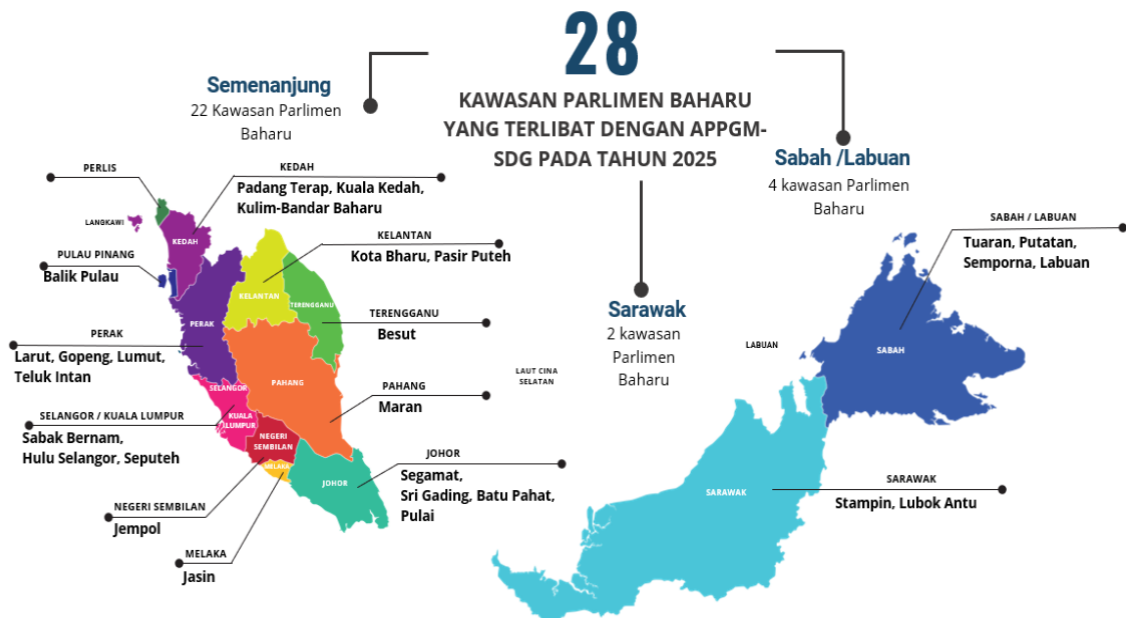
Rajah 1. 28 Kawasan Parlimen bagi Tahun 2025

Semasa di lapangan, pasukan penyelidik mengamalkan langkah etika yang ketat seperti persetujuan rakaman/visual, kerahsiaan. Namun beberapa cabaran mengiringi gerak kerja 2025. Antaranya adalah seperti kesukaran mendapatkan penyertaan seimbang merentas kelompok sasaran; kualiti audio tidak konsisten yang menuntut integrasi analitikal dengan nota lapangan; pertindihan perbualan semasa FGD yang memerlukan penyaringan teliti; serta kekangan logistik seperti jadual, tempat, fasiliti yang mempengaruhi jumlah sesi dan kejitian bukti. Walaubagaimanapun, cabaran-cabaran ini diimbangi dengan penetapan jadual semula, bantuan penghulu dan pihak pejabat daerah dan tanah untuk mobilisasi, pemetaan pihak berkepentingan yang lebih awal, serta kaedah catatan kajian berganda untuk mengekalkan integriti data.