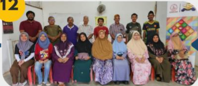
23 Februari 2025 FGD 6: Komuniti Pekebun Getah