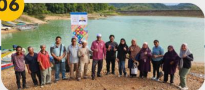
21 Februari 2025 FGD 2: Komuniti Nelayan Darat