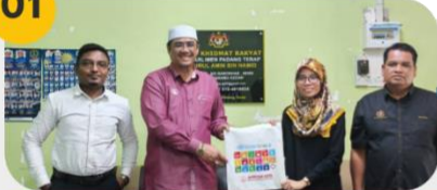
11 November 2024 Mesyuarat Awalan