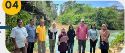
21 Februari 2025 Lawatan Tapak 1: Titi Hayun Sungai Pedu