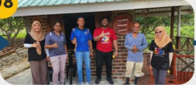
22 Februari 2025 Lawatan Tapak 3 : Kawasan Perkampungan Kg. Beris Sesi Temu Bual 1: Komuniti Siam