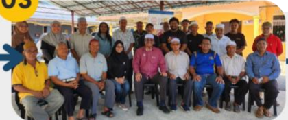
21 Februari 2025 FGD 1: Komuniti Pesawah dan Pekebun