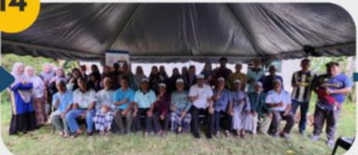
23 Februari 2025 FGD 8: Komuniti Kg. Padang