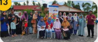
23 Februari 2025 FGD 7: Komuniti Wanita dan Ibu Tunggal