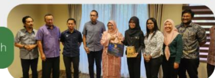
24 Februari 2025 Kunjungan Hormat ke Pejabat Daerah & Tanah Padang Terap