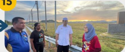
23 Februari 2025 Lawatan Tapak 3: Kedah Rubber City