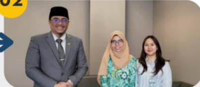
23 Disember 2024 Mesyuarat Pemprofilan