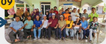
22 Februari 2025 FGD 4: Komuniti Kg. Kubang Juluk