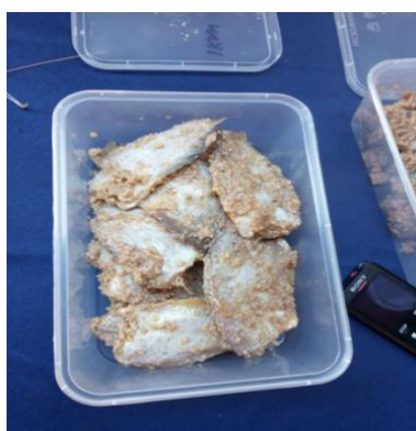
Rajah 1: Ikan Pekasam

Komuniti di DUN Anak Bukit mahir membuat ikan pekasam dan ia boleh dipromosikan dengan lebih luas untuk pasarkan produk makanan tersebut.