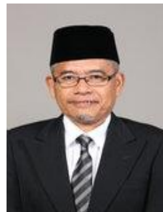
YB Dr. Ahmad Fakhruddin bin Fakhruddin

Parlimen Kuala Kedah merangkumi tiga (3) kawasan Dewan Undangan Negeri (DUN), iaitu DUN Anak Bukit, DUN Kubang Rotan, dan DUN Pengkalan Kundor. Kawasan Parlimen ini meliputi keluasan sebanyak 233 kilometer persegi dengan jumlah penduduk seramai 172,099 orang. Berdasarkan statistik tahun 2020, kepadatan penduduk di kawasan ini dicatatkan sebanyak 739 orang per kilometer persegi, yang menunjukkan tahap urbanisasi sederhana. 1 Dari segi komposisi jantina, terdapat keseimbangan yang jelas antara lelaki dan perempuan dengan nisbah 100 lelaki bagi setiap 100 perempuan. Hal ini mencerminkan pembahagian demografi yang stabil dalam kalangan penduduk setempat.