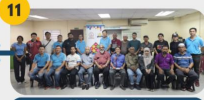
23 Februari 2025 FGD 4: Komuniti Petani Balik Pulau