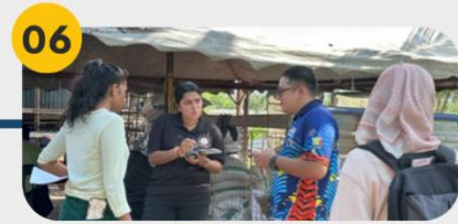
22 Februari 2025 Lawatan Tapak 2: Kawasan Ternakan di Kg. Sungai Burung