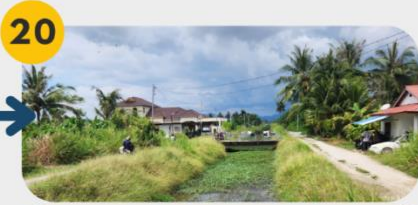
20 24 Februari 2025 Lawatan Tapak 8: Kampung Perlis