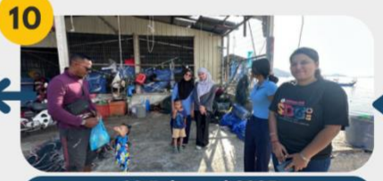
23 Februari 2025 Lawatan tapak 4: Bagan Teluk Kumbar