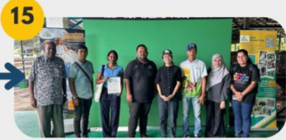
15 23 Februari 2025 Lawatan Tapak 6: Audi Dream Farm