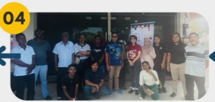
22 Februari 2025 FGD 1: Komuniti Penternak