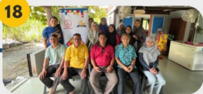
18 24 Februari 2025 FGD 8: Komuniti Warga Emas