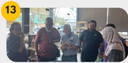
13 23 Februari 2025 Lawatan tapak 5: Peladang Outlet PPK Sri Pulau