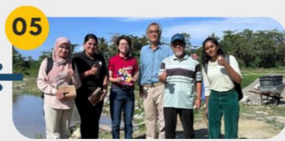
22 Februari 2025 Lawatan Tapak 1: Kolam Ternakan Ikan Keli, Kg. Bagan Air Hitam