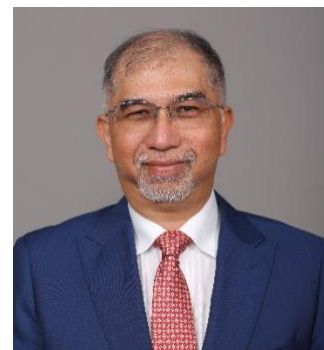
YB Dato' Muhammad Bakhtiar bin Wan Chik

Parlimen Balik Pulau (P.053) merupakan sebuah kawasan Persekutuan di Pulau Pinang, Malaysia yang mempunyai wakil di Dewan Rakyat. Ahli Parlimen Balik Pulau kini disandang oleh YB Dato' Muhammad Bakhtiar bin Wan Chik, dari Parti Keadilan Rakyat (PKR), sebuah parti komponen dalam gabungan Pakatan Harapan (PH). Pada Pilihan Raya Umum ke-15 (2022), YB Dato' Muhammad Bakhtiar bin Wan Chik berjaya memperoleh kemenangan di kerusi Parlimen Balik Pulau dengan majoriti sebanyak 1,582 undi.