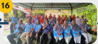
16 23 Februari 2025 FGD 7: Komuniti Sukarelawan Wanita