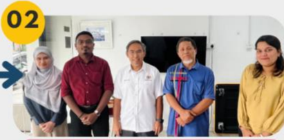
27 Januari 2025 Mesyuarat Pemprofilan