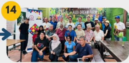
14 23 Februari 2025 FGD 6: Komuniti Pelancongan