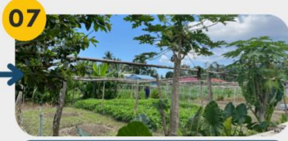
22 Februari 2025 Lawatan Tapak 3: Penglibatan Warga Asing dalam Pertanian dan Penternakan