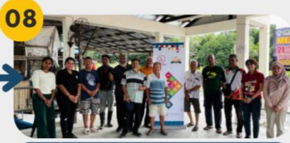
22 Februari 2025 FGD 2: Komuniti Nelayan Pantai