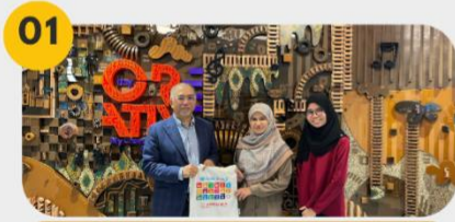
13 Januari 2025 Mesyuarat Awal