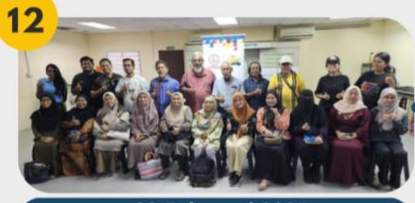
23 Februari 2025 FGD 5: Komuniti Usahawan