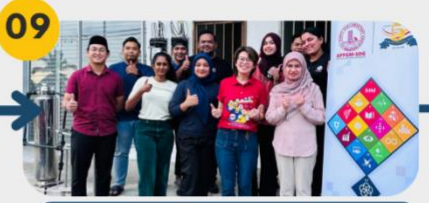
22 Februari 2025 FGD 3: Komuniti Belia