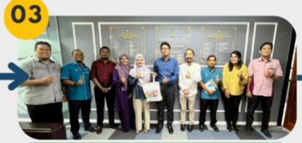
27 Januari 2025 Mesyuarat Pra-lawatan