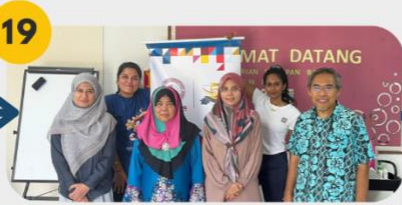
19 24 Februari 2025 FGD 9: Komuniti Orang Kurang Upaya