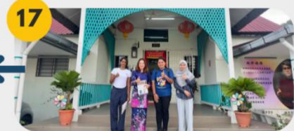
17 24 Februari 2025 Lawatan Tapak 7: Chin Hwa Chinese Primary School