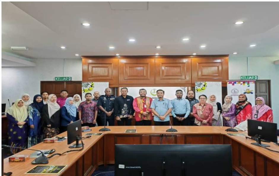
Rajah 2. Mesyuarat Inter-Agensi P074 Lumut