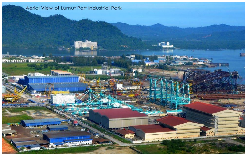
Rajah 1. Lumut Port Industrial Park