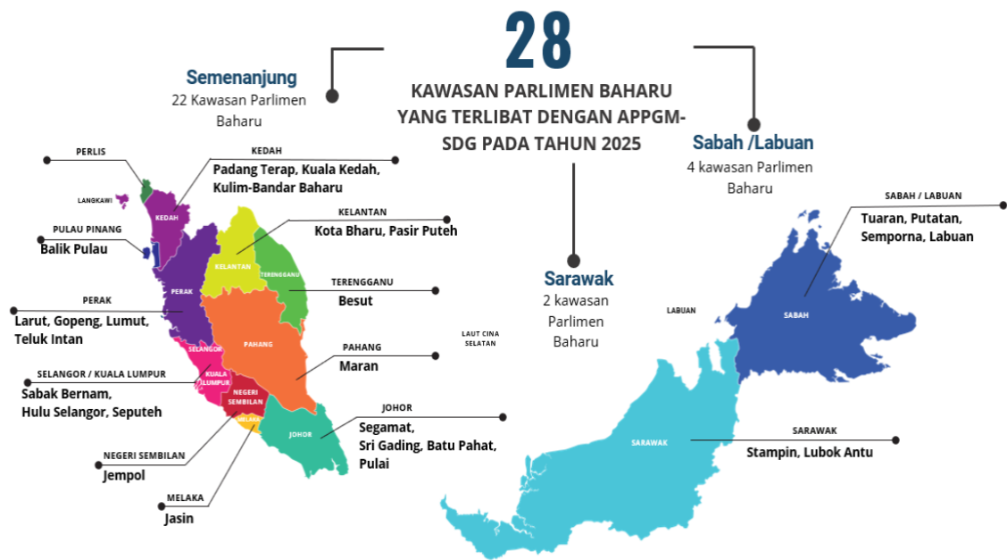
Rajah 1. 28 Kawasan Parlimen bagi Tahun 2025

Semasa di lapangan, pasukan penyelidik mengamalkan langkah etika yang ketat seperti persetujuan rakaman/visual, kerahsiaan. Namun beberapa cabaran mengiringi gerak kerja 2025. Antaranya adalah seperti kesukaran mendapatkan penyertaan seimbang merentas kelompok sasaran; kualiti audio tidak konsisten yang menuntut integrasi analitikal dengan nota lapangan; pertindihan perbualan semasa FGD yang memerlukan penyaringan teliti; serta kekangan logistik seperti jadual, tempat, fasiliti yang mempengaruhi jumlah sesi dan kejitian bukti. Walaubagaimanapun, cabaran-cabaran ini diimbangi dengan penetapan jadual semula, bantuan penghulu dan pihak pejabat daerah dan tanah untuk mobilisasi, pemetaan pihak berkepentingan yang lebih awal, serta kaedah catatan kajian berganda untuk mengekalkan integriti data.