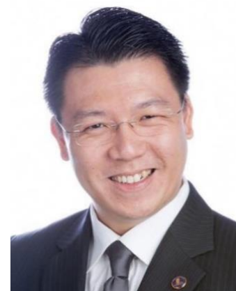
YB Tuan Nga Kor Ming

iaitu komponen parti dalam gabungan Pakatan Harapan (PH) telah memenangi kerusi bagi Parlimen Teluk Intan. 2 Beliau kini berkhidmat sebagai Menteri Perumahan dan Kerajaan Tempatan. Program pemetaan isu bagi tahun 2025 di Parlimen Teluk Intan ini diadakan dengan usahasama daripada YB Tuan Nga Kor Ming.